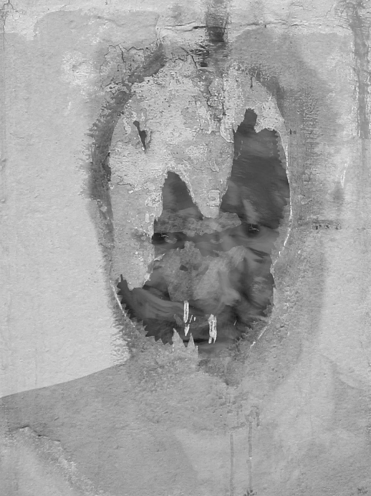
Filmstill: Markus Goessi - Wann wird Man(n) | Video HD mit Audio Stereo, Hochformat 02:58, - 2025