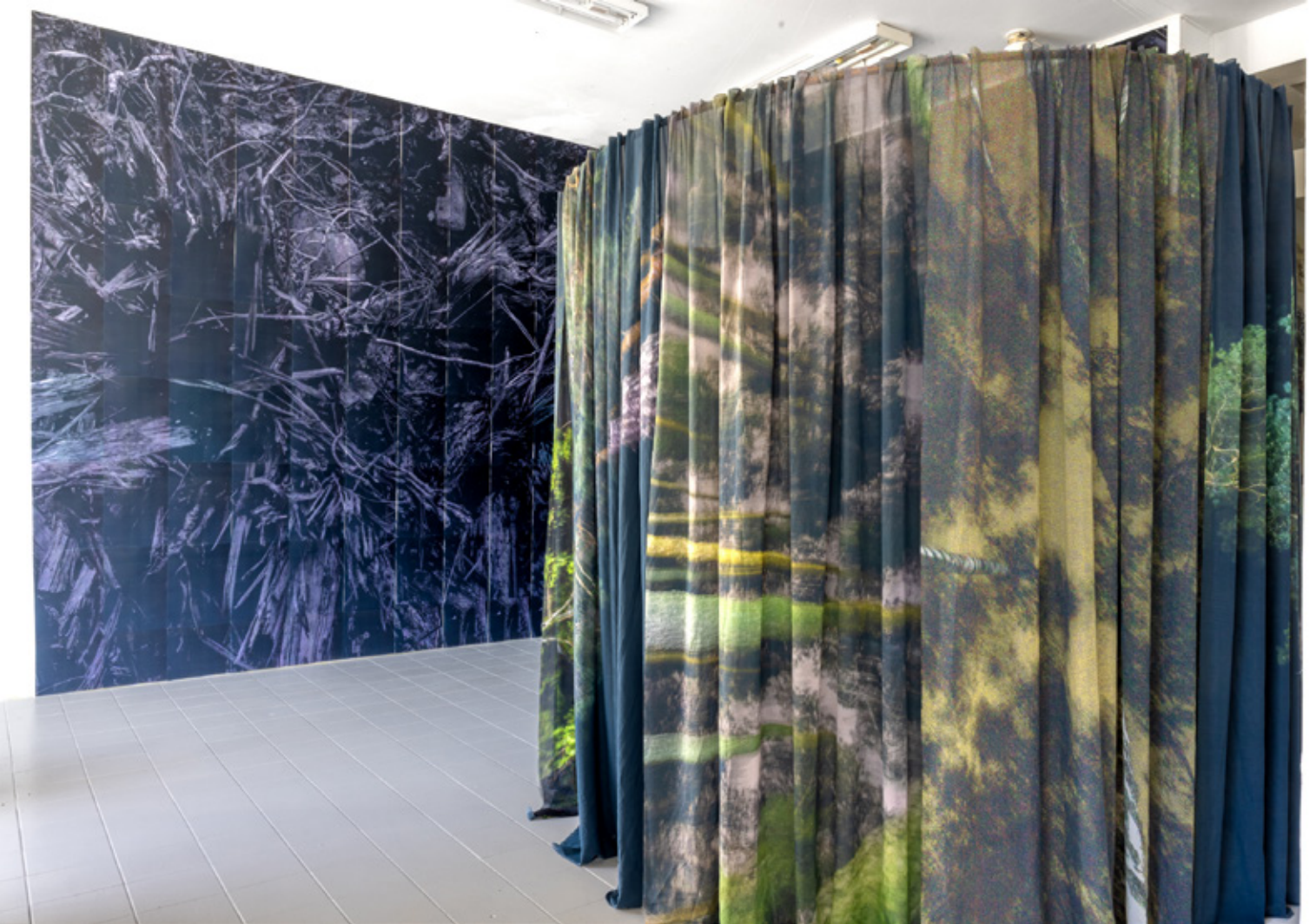
Sibylle Feucht - Ausstellung „Darking“, Molekyl Gallery, Malmö/SE, 2025 Wandinstallation „Dark Matter #46“ (2023/25) und „Darking“ (2025) Rauminstallation mit Audio