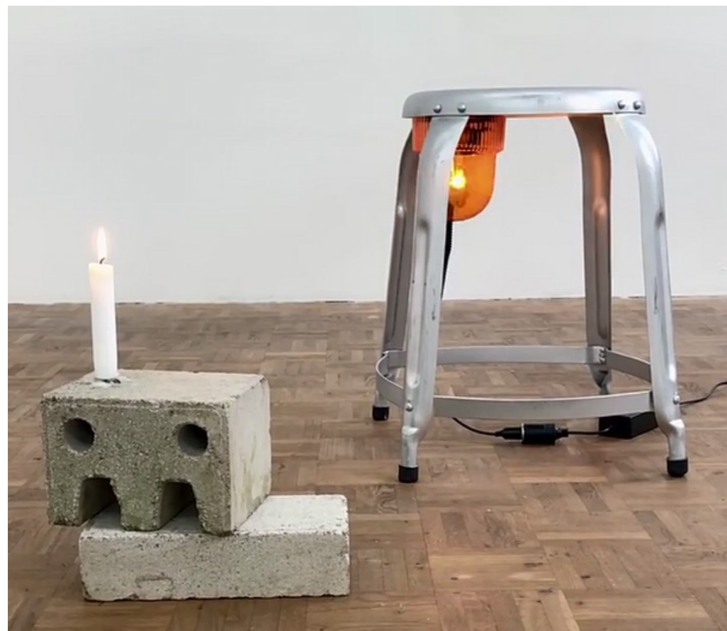
Stephan Wittmer _TRUCK, 2024 Alarmleuchte unter Metallstuhl _MEMENTO MORI, 2025. Sandbausteine mit Kerze, ca. 25 x 35 x 12 cm