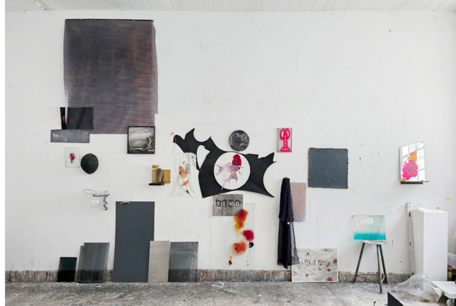
Rainer Barzen - Atelieraufnahme 2026