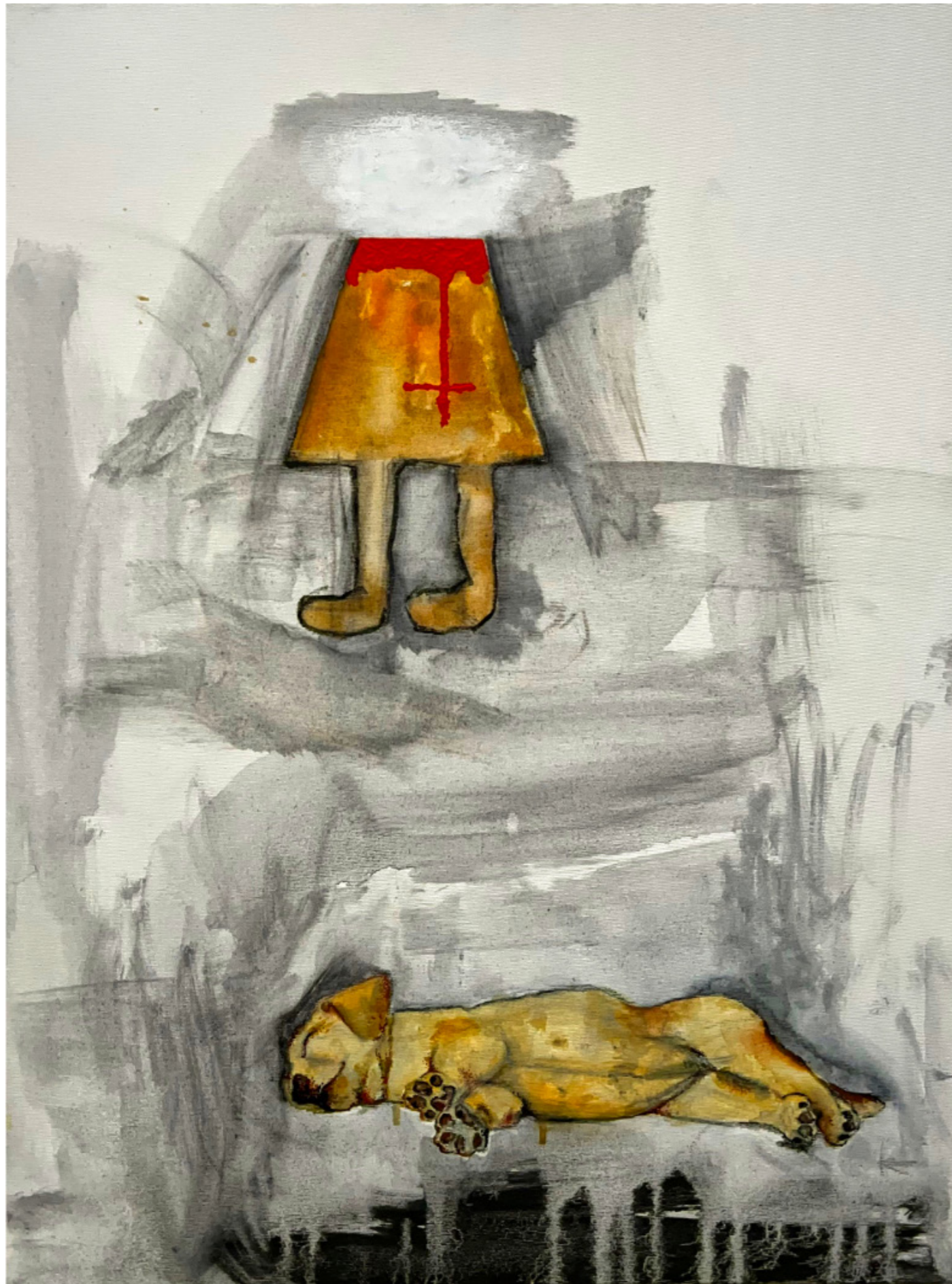
Matthias Aeberli - Big Sleep, 2025 | Acryl on Canvas