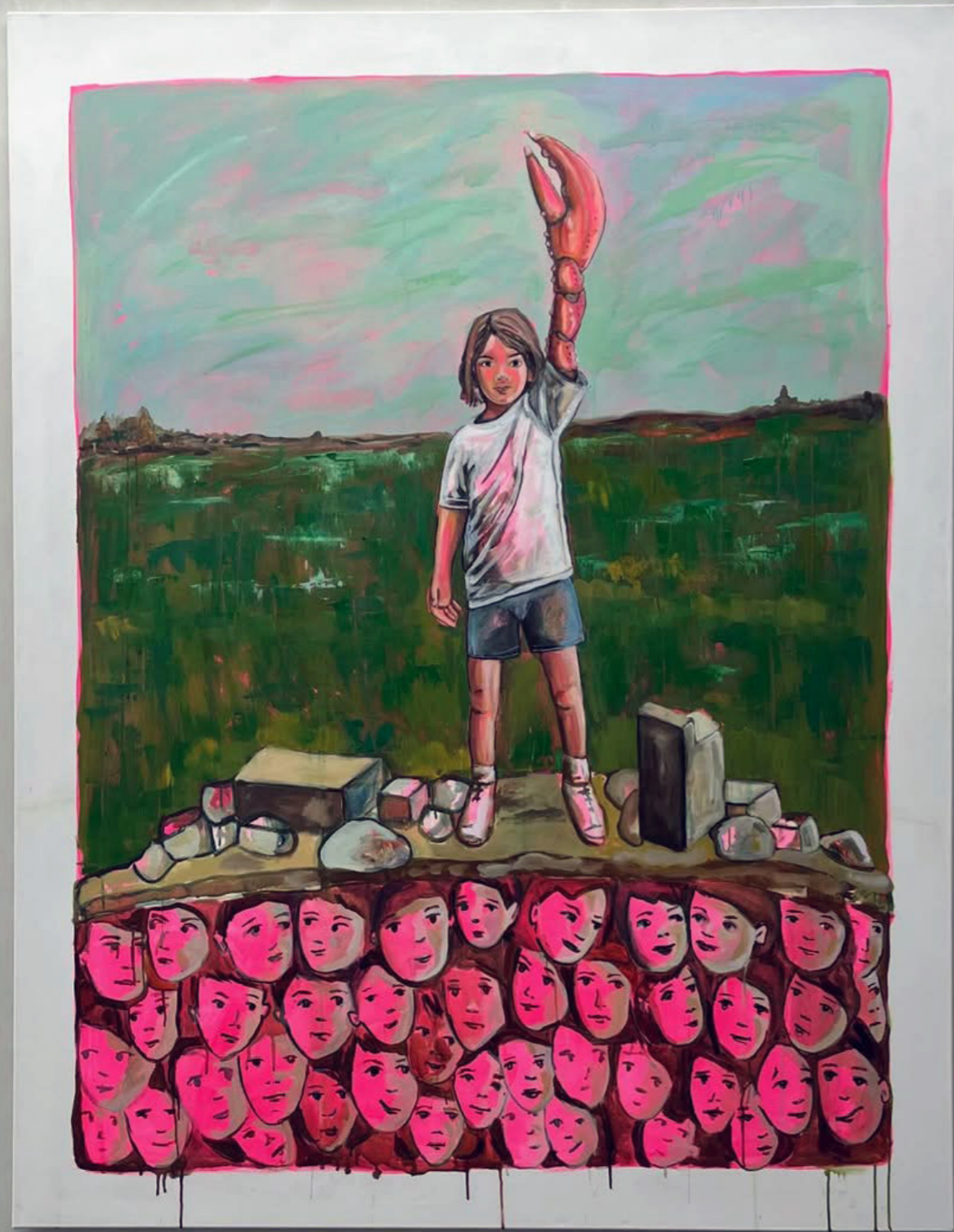
Yota Tsotra - The Hope of the Lobster Child, 2025 | Acrylic and oil on canvas