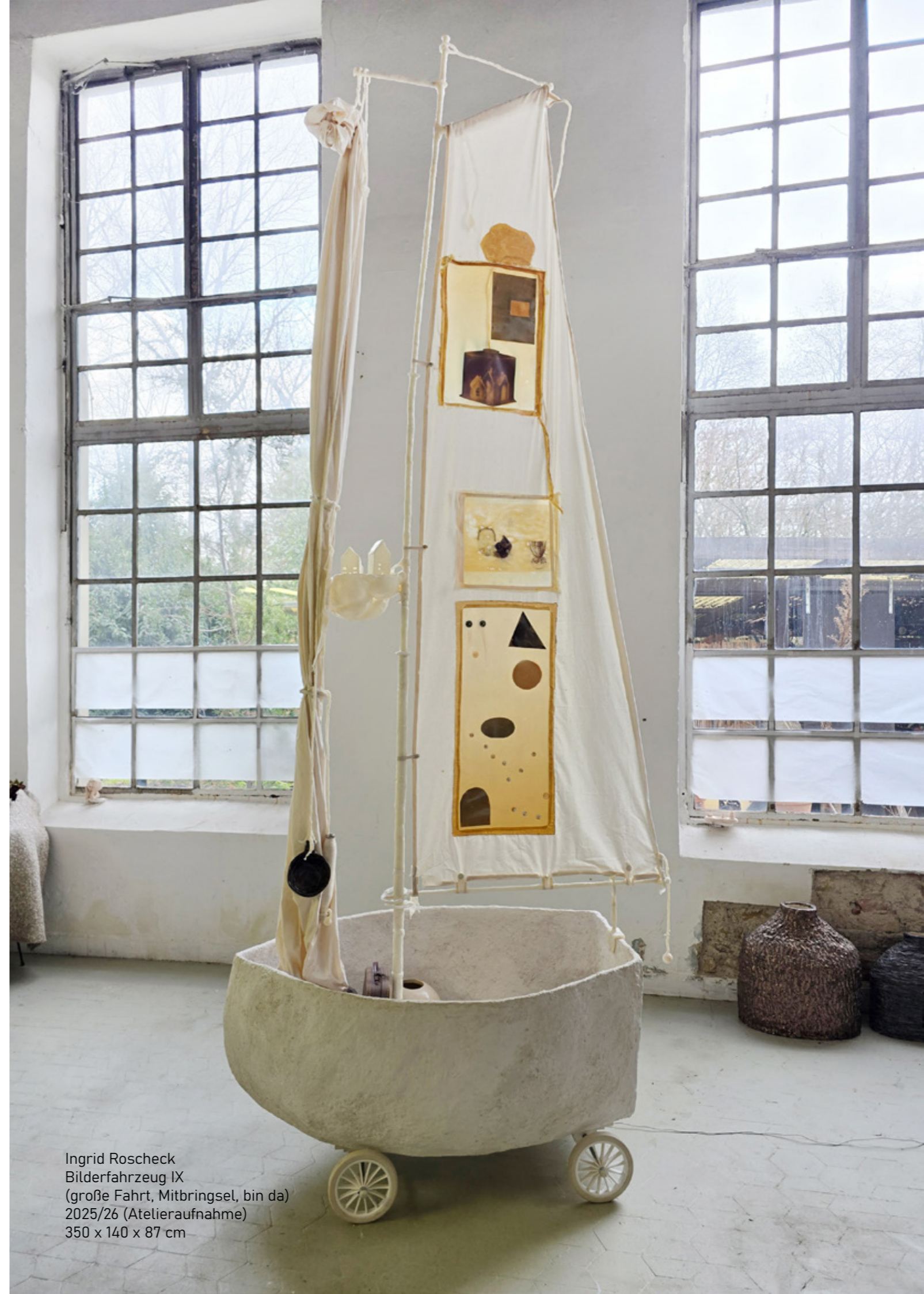
Ingrid Roscheck Bilderfahrzeug IX (große Fahrt, Mitbringssel, bin da) 2025/26 (Atelieraufnahme) 350 x 140 x 87 cm