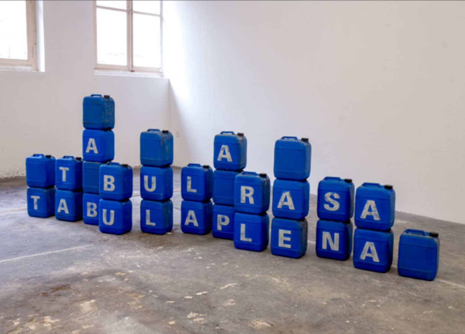
stöckerselig - Tabula Rasa-Tabula Plena, 2025