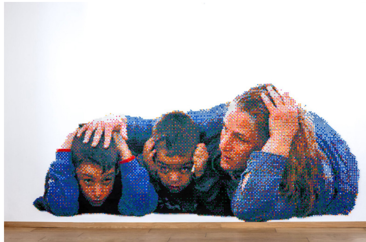
Sibylle Feucht - on the ground | plastic beads melted together | 175 x 420 cm