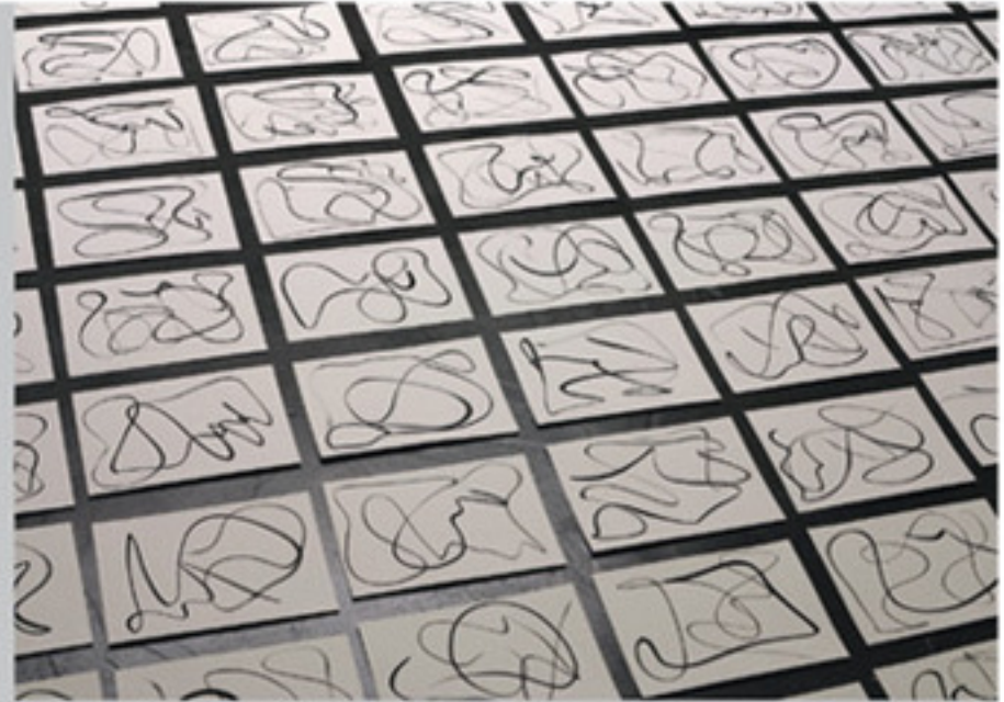
Anja Braun, One more time, Eisenoxidschwarz und Zinnoberrot auf Papier.

Lücke – Systemfehler durch Irrtum und Defekt 17. 2. - 8. 4. Vernissage: Freitag, 16. Februar 19 Uhr Eine Gruppenausstellung